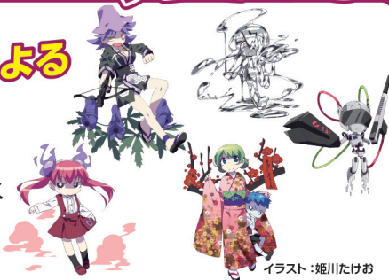
イラスト:姫川たけお

ユニークなキャラクターたちが、毒ワールドを分かりやすく解説して、ドキドキ・ワクワクさせちゃいます!