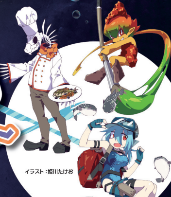
イラスト: 堀川たけお