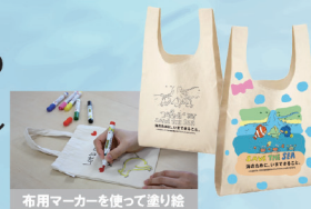
布用マーカーを使って塗り絵

[日 時] 8/4 (日) [時 間] 10:00~12:00 13:30~15:30 ※(1日2回実施 各先着100名) [場 所] 宮崎県総合博物館 エントランスホール 事前申し込みなし